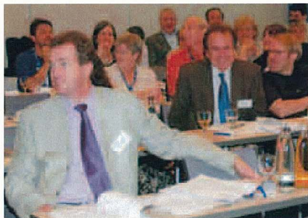
Einer der Hauptredner der öffentlichen Kundgebung: Prof. Klaus Töpfer (Foto oben) sowie ein Blick ins Plenum der 90 Delegierten aus 25 Nationen, die sich in Berlin trafen

Mit einem Appell für eine nachhaltige Wohnungspolitik und einer Warnung vor den Folgen des Ausverkaufs der öffentlichen Wohnungen wandte sich die Internationale Mieterallianz (IUT) auf ihrem 17. Weltkongress an die Öffentlichkeit