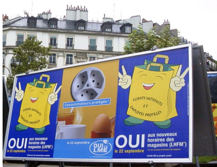
Affiche à Genève sur le referendum pour les nouveaux horaires d'ouverture des magasins.

Par François Zutter, ASLOCA Switzerland, www.smv-asloca-asi.ch