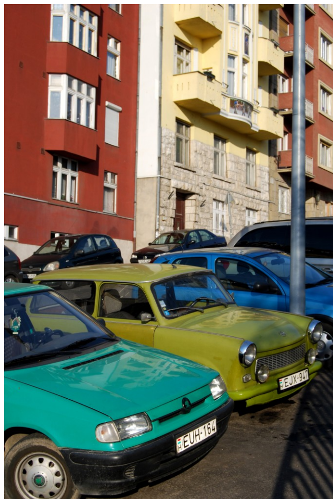
Les niveaux de logements en mauvais état atteignent 10% en Hongrie – mais à Budapest, des investissements ont rendu la rénovation des bâtiments possible.

Quel système fonctionne le mieux ? Ma récente étude tente de répondre à cette question ; quel système peut garantir un logement décent pour chaque citoyen ? Deux hypothèses sont issues de résultats empiriques. La première hypothèse concerne la stratégie de la politique sélective qui représente souvent un secteur locatif où les bénéficiaires des logements sociaux ont des faibles revenus. Le concept derrière le