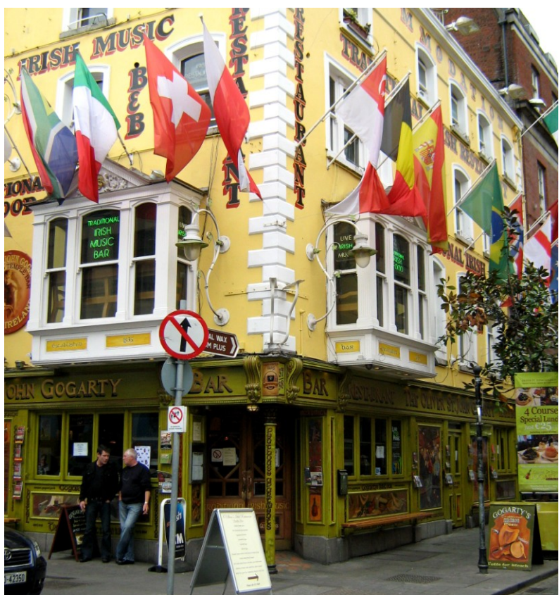
Les habitants de Dublin apprécient leurs pubs.

Des habitations vides et des lotissements non terminés sont deux des caractéristiques du paysage irlandais en matière de logement dans l'atmosphère actuelle de récession, un sous-produit du krach immobilier arrivé en Irlande. L'enquête 2012 sur le développement national du logement a montré que la plupart des lotissements vides étaient situés en zones rurales. Cela ne correspond pas forcément à la demande de logements, et beaucoup de ces biens, situés dans ces lotissements fantômes ou de l'Agence nationale de gestion des actifs (NAMA) qui a été créée pour subtiliser les mauvaises créances du secteur bancaire, ne conviennent pas vraiment pour des locations. C'est particulièrement vrai pour les personnes avec des besoins spécifiques ou celles qui souhaitent avoir des services près de chez elles.