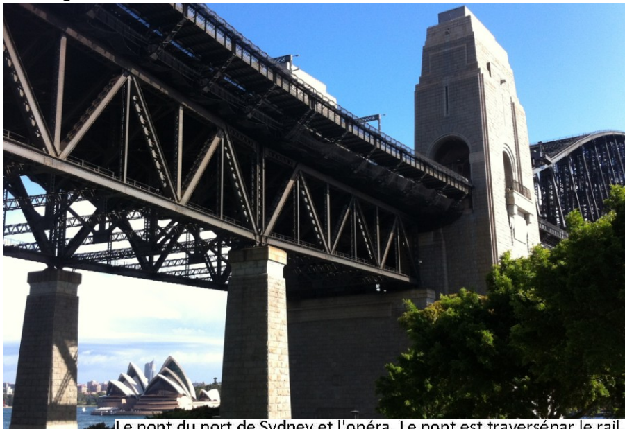
Le pont du port de Sydney et l'opéra. Le pont est traversé par le rail, les automobiles, la bicyclette et les piétons entre le quartier des affaires de Sydney central et le rivage du Nord.

La différenciation entre la défense directe des intérêts , assuré par le TAASs et le travail sur les réformes politiques et législatives, assuré par le TU, fonctionne souvent bien. Le TAASs peut, grâce à son travail sur des cas individuels, identifier des tendances et problématiques locales, que le TU peut ensuite étudier. Chaque TAAS est situé dans une zone géographique et démographique spécifique, afin de poursuivre et développer des domaines d'expertise localisés. Ils s'informent fréquemment et se conseillent. Le TU participe aux discussions, et est bien placé pour soulever des problèmes d'une nature structurelle auprès des représentants de gouvernement et de l'industrie.